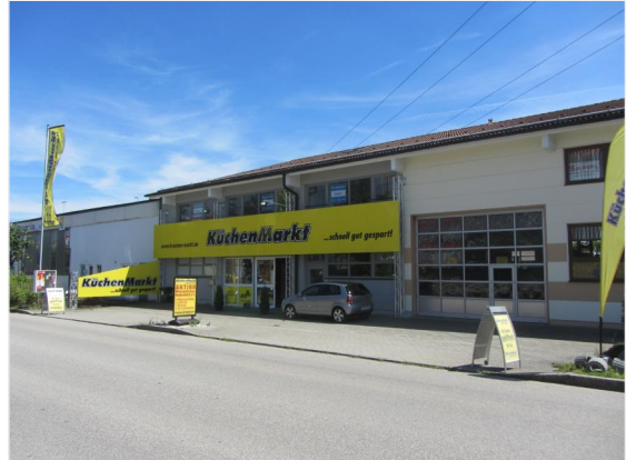
Hausansicht und Zugang